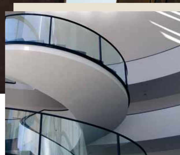
GROSS: NEUES MUSEUM IN NÜRNBERG, BAYERN. KLEIN: TREPPE IM NEUEN MUSEUM IN NÜRNBERG, BAYERN.